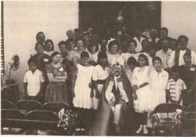
Visita Pastoral Iglesia San Rafael Arcángel, Yauco.