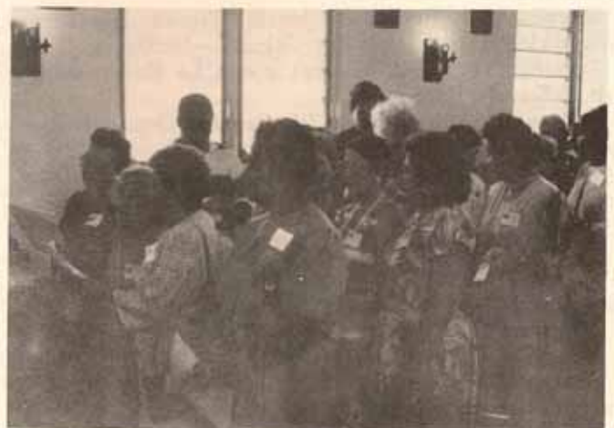
Oficio de clausura del Cursillo de Renovación Cristiana para Mujeres celebrado en las facilidades del hospital San Lucas y el Convento de San Bernabé, Ponce.