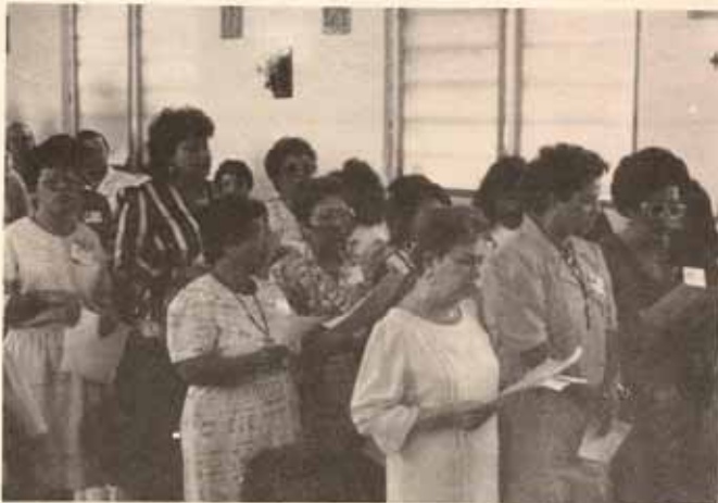
Vista parcial de los asistentes al cursillo de renovación cristiana, Ponce.