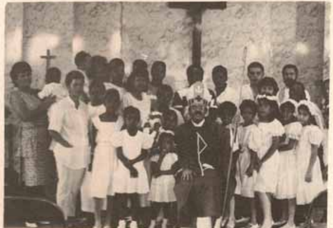
Visita Pastoral Iglesia San Miguel Arcángel, Ponce.