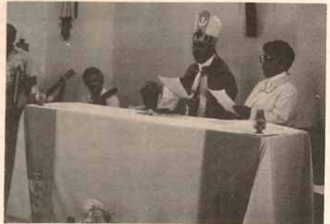
El Obispo Alvarez en celebración eucarística en el cursillo de renovación cristiana para mujeres, en Ponce.