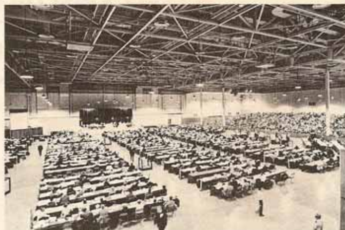
Vista de la Cámara de Diputados.

Convención. 6,400 personas llenaron el auditorio donde se llevó a cabo la misa en un altar central y en 7 altares a lo largo del auditorio. El Obispo presidente fue el celebrante principal. El sermón estuvo a cargo del muy Reverendo Donald Coggan, Arzobispo de Cantorbury, quien enfatizó la necesidad para una misión mundial de la Iglesia y el papel que los 96,000,000 de dólares dentro del programa Aventuras para Misión desempeñarían en la expresión misionera.