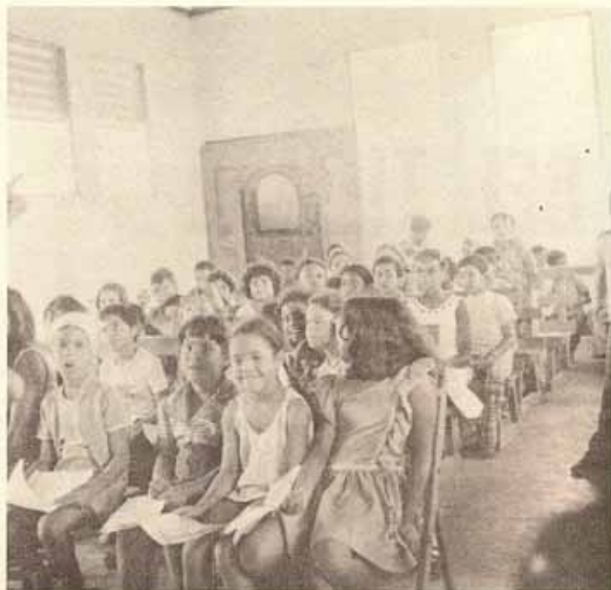
Escuela Bíblica de verano, Iglesia La Resurrección, Manatí.