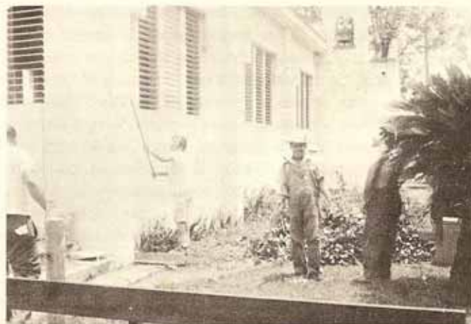
Iglesia Sagrada Familia.

La Junta Parroquial de Sagrada Familia y -El Comité Fondo Restauración Templo.