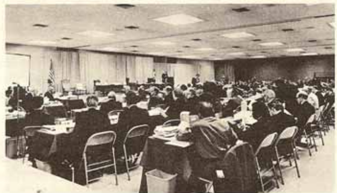
Cámara de Obispos