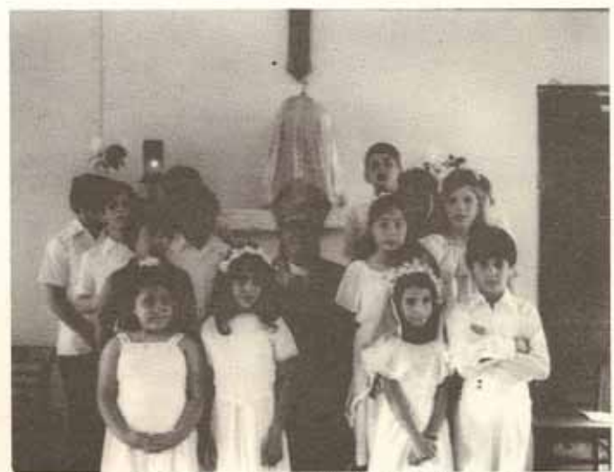
Clase de confirmación, Iglesia San Bartolomé, Lares.