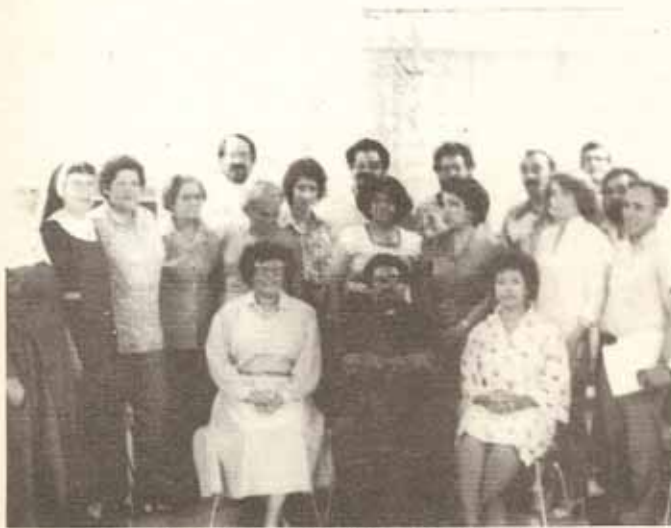
Delegados a la Asamblea del Area Sur.