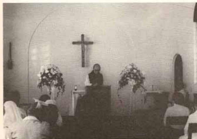
Celebración del Día de San Lucas en la capilla del Hospital San Lucas, Ponce.