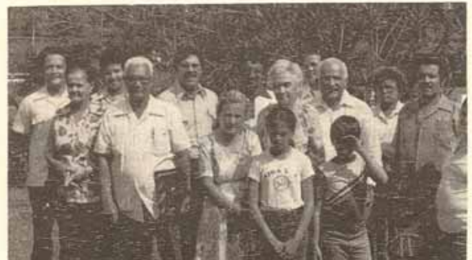
Participantes en cursos de Encuentro Congregacional entre las Iglesias San José, San Francisco y Sta. Hilda.