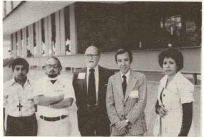
Parte de nuestra delegación a la Convención.

¿Cuál era la Agenda de esta Convención General de la Iglesia Episcopal de los Estados Unidos de América? He aquí algunos ítems: el libro de Oración Común; el presupuesto para los próximos 3 años; constitución y cánones, evangelismo; ecumenismo; ordenación de homosexuales; fondo de pensiones; estructura; asuntos nacionales e internacionales; obispos retirados; capellanes examinadores; publicaciones episcopales; ministerio; hambre; nuevas diócesis; autonomía para P.R. elecciones de oficiales; liturgia; crisis urbana; aventura en