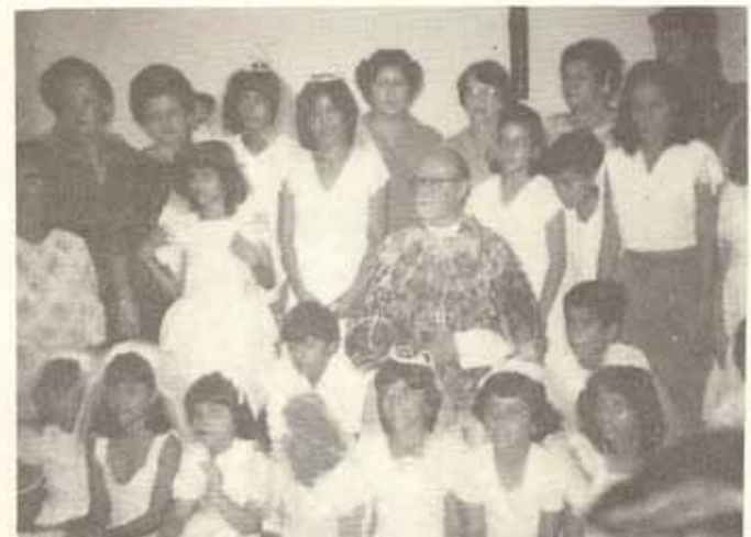
Visita Pastoral a la Iglesia Sto. Nombre de Jesús, Bo. Pastillo, Ponce.