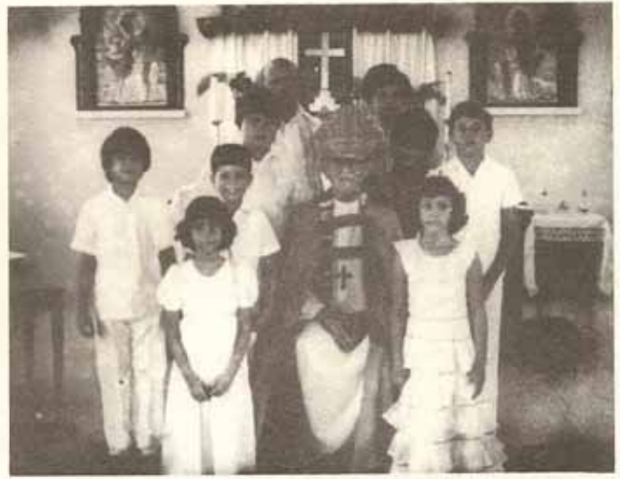
Clase de confirmación, Iglesia Sta. María Virgen, Ponce.