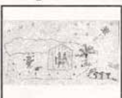
Anamarie Rivera San Judas Tadeo