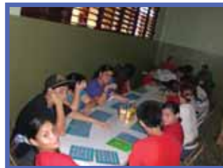
Noche de Cine en Mayagüez