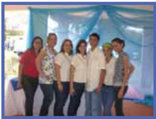
Asamblea # 22