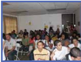
Vigilia Pascual "Seamos Luz del Mundo."