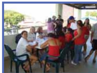
Encuentro de Jóvenes Universitarios