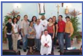
Instalación del Equipo