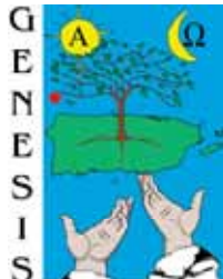
Asociación de la Juventud de la Iglesia Episcopal Puertorriqueña