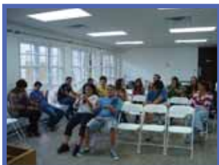
Retiro de Adviento "Y Así Comenzó la Creación..."