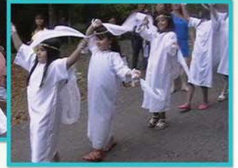
9 de abril Retiro de Cuaresma Arcedianato Nordeste II