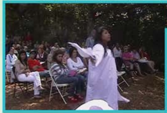
9 de abril Retiro de Cuaresma Arcedianato Centro-Oeste