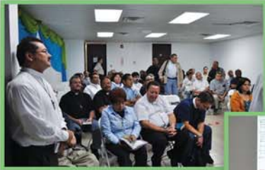
12 de marzo Retiro de Cuaresma para el Clero y Postulantes