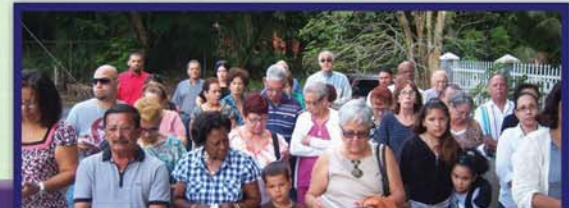
17 de abril Domingo de Ramos en Misión San Pedro Apóstol