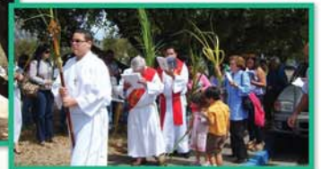
17-24 de abril Semana Santa en Catedral San Juan Bautista