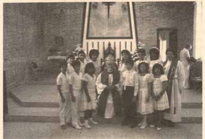
Visita Pastoral Iglesia La Reconciliación, Quebrada Limón, Ponce, P.R.