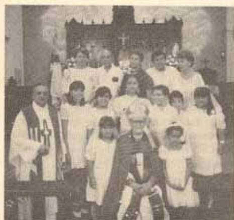
Confirmación iglesia San Andrés, Mayagüez, P.R.