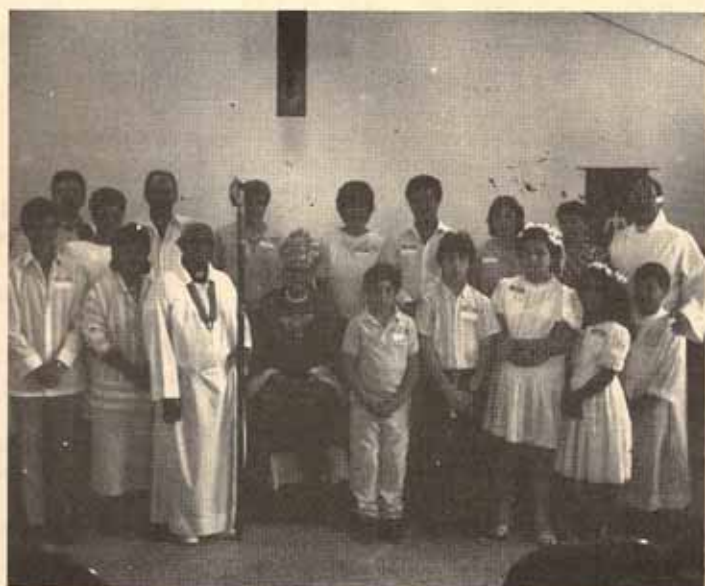
Confirmación Iglesia Santa Hilda, Bo. Las Cuevas, Trujillo Alto, P.R.