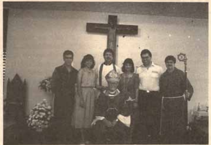
Visita Pastoral Iglesia San Pedro y San Pablo, Bayamón, Puerto Rico