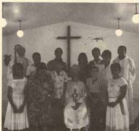
Visita Pastoral Iglesia Santo Nombre, Pastilo, Ponce, Puerto Rico