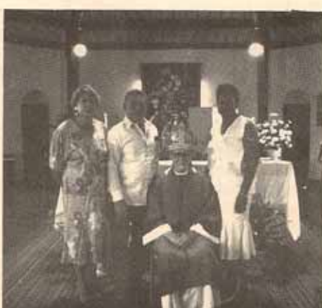
Visita Pastoral Iglesia Santo Tomás, Carolina, P.R.