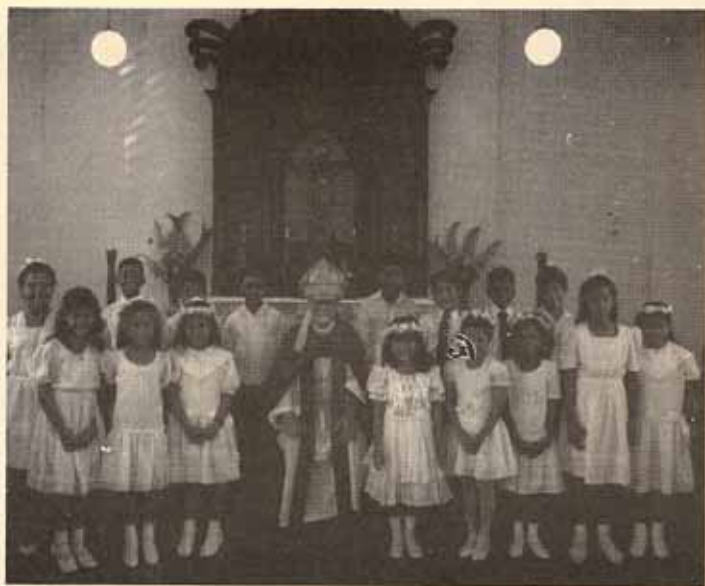
Confirmación Iglesia Todos los Santos, Vieques, P.R.