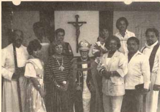
Visita Pastoral Iglesia San Francisco de Asís, Carolina, Puerto Rico