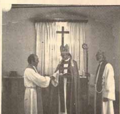
Instalación Padre Federico Salcedo