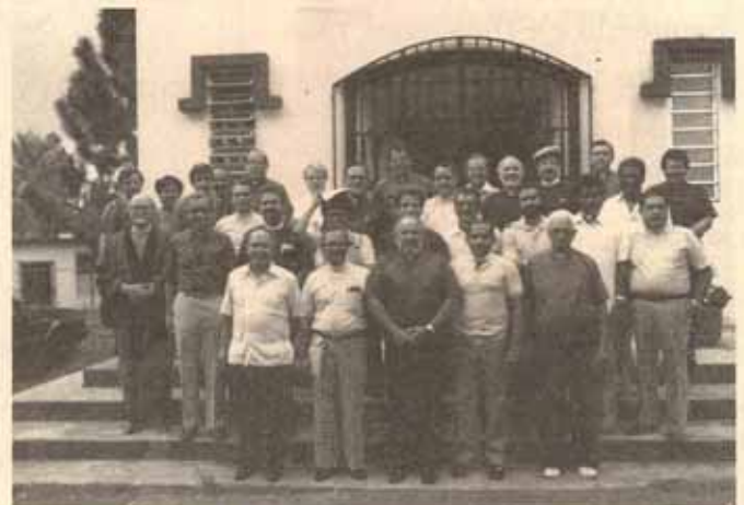
Conferencia del Clero con el Sr. Obispo Reus en San Justo, P.R.