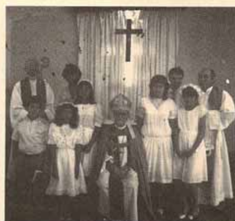
Confirmación Iglesia San Bartolomé, Castañer, P.R.