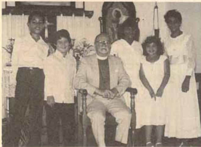
Confirmación Iglesia Santa Maria Virgen, Ponce, P.R.