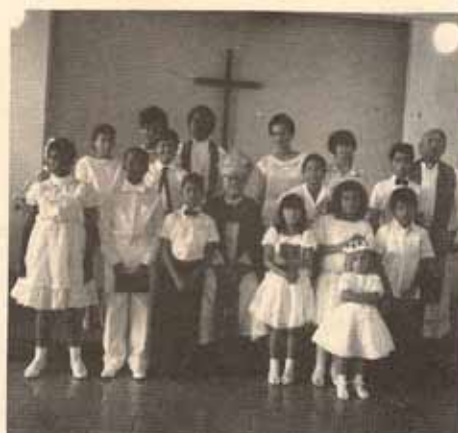
Confirmación Iglesia Buen Pastor, Fajardo, P.R.