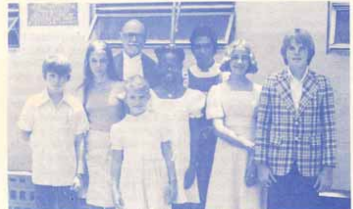
Confirmación en la Catedral Habla Inglesa.