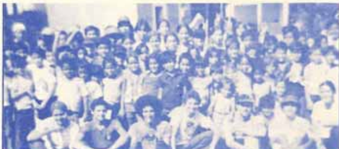
Programa de Verano de la Iglesia Episcopal La Reconciliación. Celebrado los días 27 de junio al 15 de julio 1977.