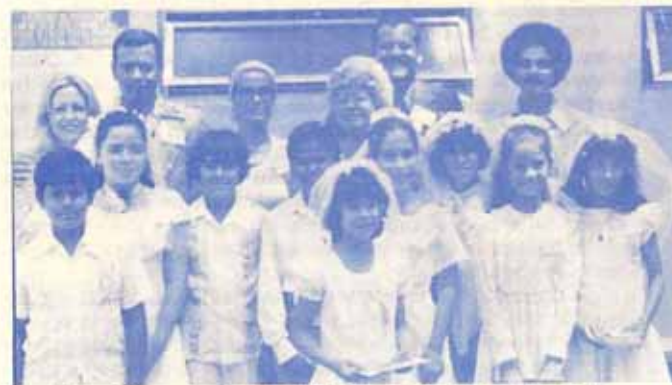
Confirmación en la Catedral Episcopal San Juan Bautista.