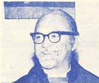
Monseñor Francisco Reus-Froylán

En 1964, el Obispo Swift consciente del desarrollo de recursos propios en la Iglesia y simpatizando con la necesidad del liderazgo indígena, renuncia al Episcopado en Puerto Rico, abriendo así el paso para la elección y consagración del 1er. puertorriqueño como Obispo Diocesano de la Iglesia Episcopal Puertorriqueña, Francisco Reus Froylán.