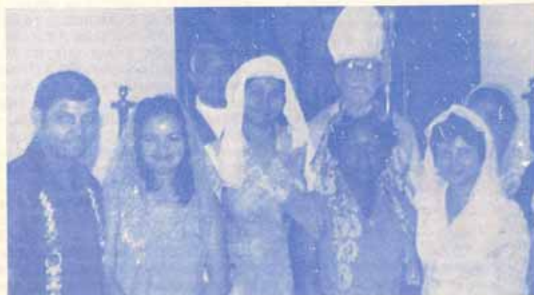
Confirmación en la Iglesia Episcopal Todos Los Santos en Vieques.