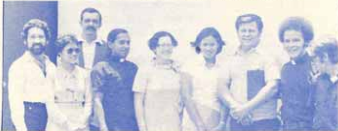
Instalación de la oficialidad del área centro oeste. En la Iglesia Santa Cruz.