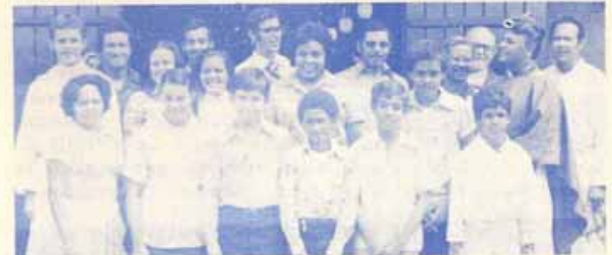
Confirmación en la Iglesia Episcopal El Buen Pastor - Fajardo.