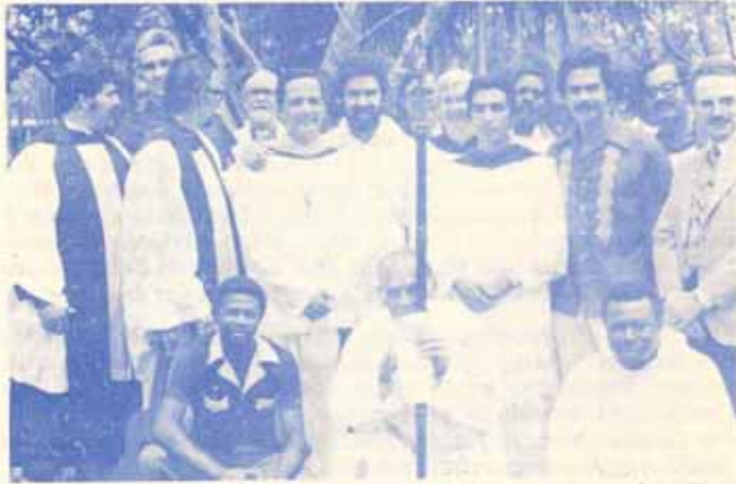
Facultad y Estudiantes en la ocasión de la primera graduación de Estudio.