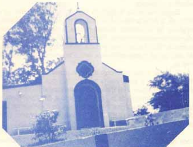
Que bella quedó nuestra Iglesia Episcopal San José en Caimito.