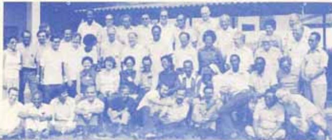
Reunión en Panamá. Compañeros en Misión. Hubo representación de toda la Parroquia.