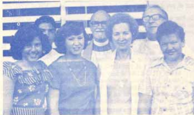
Confirmación en la Iglesia Episcopal San Francisco de Asís en Country Club.