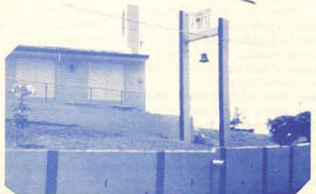
Eh aquí el esfuerzo de todos. Esto es parte de nuestra mayordomía.