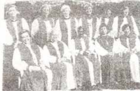
Foto histórica de las 11 obispos femeninas de la Comunión Anglicana que se unieron a 750 colegas varones en la Conferencia de Lambeth

También se respaldó la idea de un Congreso de Laicos a celebrarse en África del Sur que atraería a más de 4,000 delegados para tratar temas