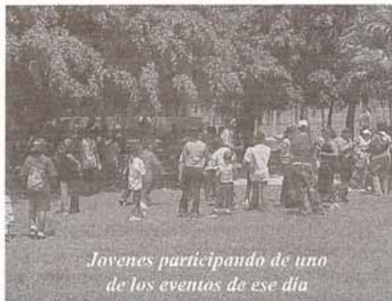
Jóvenes participando de uno de los eventos de ese día

Álvarez y luego disfrutaste de un día de convivencia, juegos y despliegue de talentos. Brincar la cuica, relevo, halar la sogá, volley ball, entre otros, fueron parte de los juegos recreativos que se realizaron hasta el mediodía. En la tarde se llevó a cabo el "talent show" el cual contó con un gran número de