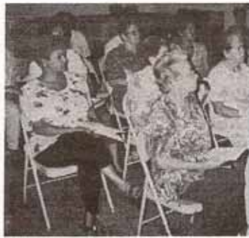
Algunas de las participantes de la charla.